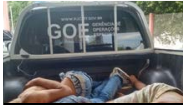
Bandidos mortos teriam vindo de Porto Velho e praticado uma série de assaltos na região

O caso aconteceu na tarde da última quinta-feira (03), onde quatro criminosos morreram durante troca de tiros com a Polícia Militar e Polícia Civil.